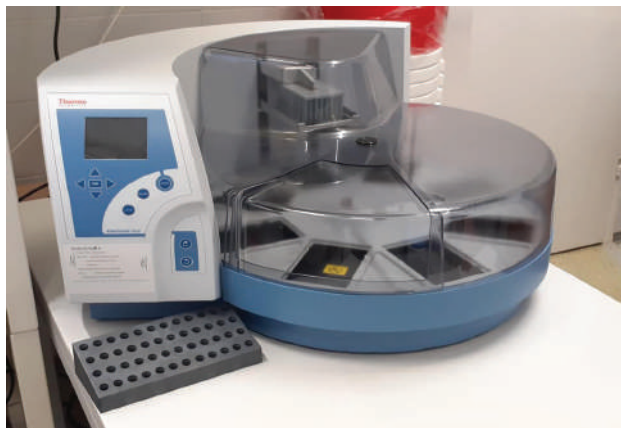
Нови PCR уређај и DNA екстрактор