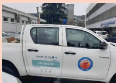
Возило ДДД службе ИЈЗЦГ

Кроз активности ЈЗУ Института за јавно здравство Републике Српске, до сада је сакупљен 21 узорак на локацијама у Требињу, Градишци, Костајници, Новом Граду, Козарској Дубици и Бањалуци.